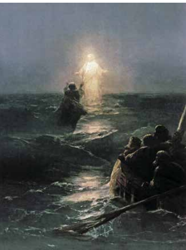
«Хождение по водам». Фрагмент. Холст. Масло. 1863 г.

Не то, что мните вы, Природа – не слепок, не бездушный лик. В ней есть душа, в ней есть свобода, В ней есть любовь, в ней есть язык.