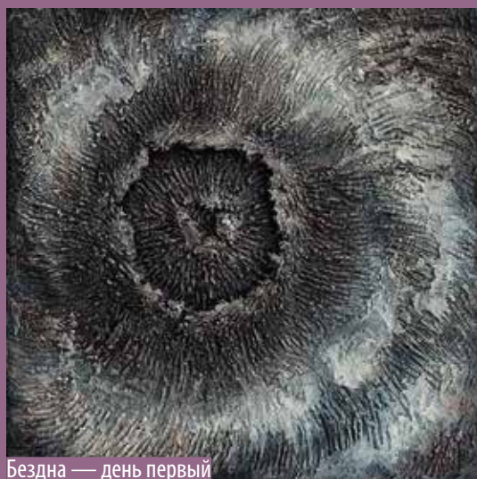
Бездна — день первый