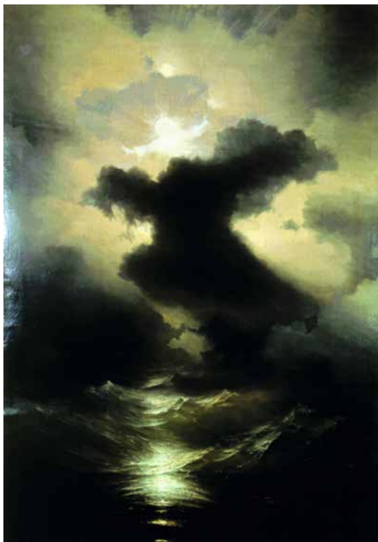
Хаос. Холст. Масло. 106x75 см. 1864 г.

Картина «Хаос. Сотворение мира» была написана Айвазовским в Италии в 1841 году. Картина привлекла внимание Папы Григория XVI, и он приобрел ее для музея Ватикана, наградив художника золотой медалью. Гоголь веселой шуткой поздравил Айвазовского: «Исполать тебе [Ай, да молодец], Ваня! Пришел ты, маленький человек с берегов Невы, в Рим и сразу поднял хаос в Ватикане». К этому времени художник уже был известен в Италии как первоклассный автор марин — морских пейзажей.