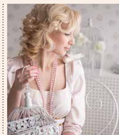
Фото из семейного альбома Алексея и Татьяны Зыбиных из города Краснодара. Фото Инны Леготкиной