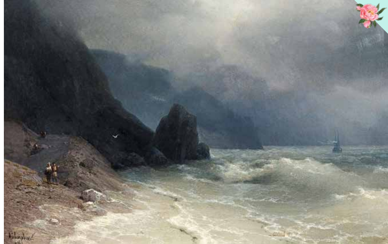
Морское побережье. Масло. Холст. 46,5 x 67 см. 1886 г.

Картина «Хаос. Сотворение мира» была написана Айвазовским в Италии в 1841 году. Картина привлекла внимание Папы Григория XVI, и он приобрел ее для музея Ватикана, наградив художника золотой медалью. Гоголь веселой шуткой поздравил Айвазовского: «Исполать тебе [Ай, да молодец], Ваня! Пришел ты, маленький человек с берегов Невы, в Рим и сразу поднял хаос в Ватикане». К этому времени художник уже был известен в Италии как первоклассный автор марин — морских пейзажей.