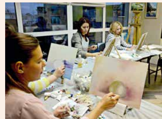
Мастер-классы по живописи

В один из дней я совсем потеряла веру и просто не знала, что делать. Ведь у меня есть дар, так меня сотворил Господь. Не может быть, чтобы я имела талант и при этом жила в нужде! В Библии написано, что каждый труд достоин оплаты. Мне пришла мысль молиться об успехе до тех пор, пока я не увижу ответа, и делать, что могу, без ожиданий. Я наконец-то поняла,