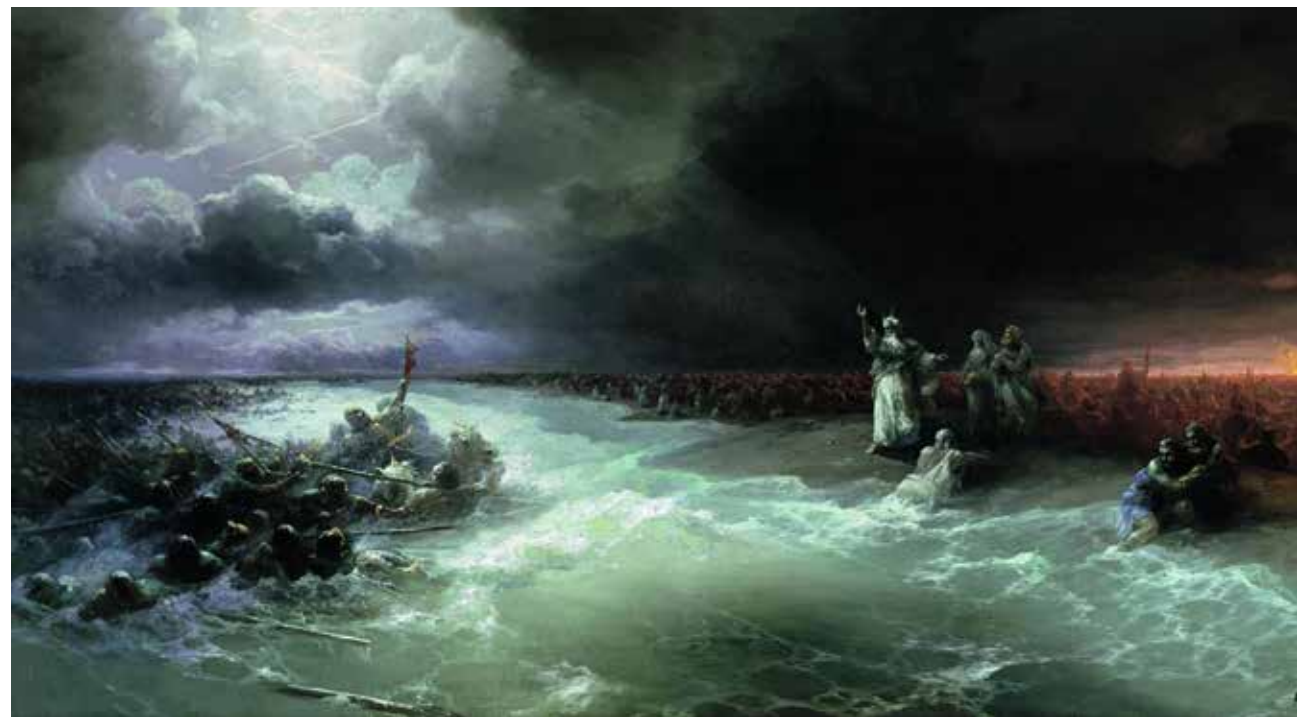
Переход евреев через Черное море. Холст. Масло. 1891 г.

Шестидесятые-семидесятые годы для Айвазовского стали временем размышлений, духовной зрелости, ос-