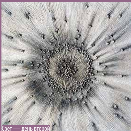
Свет — день второй

Картина написана по мотивам книги Бытие, глава 1, стихи 1–2: