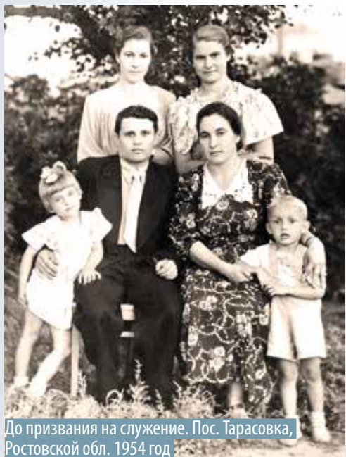
До призвания на служение. Пос. Тарасовка, Ростовской обл. 1954 год